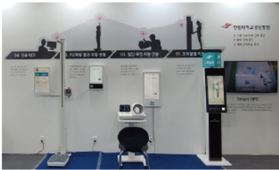
2022 K-Hospital 스마트 선도병원 적용 사례